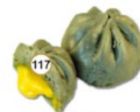
117 L SESAME SWEETBUN Gestoomd zoet broodjes