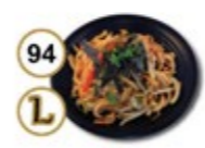
94 L UDON NOODLES Gebakken udon noedels