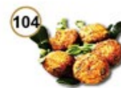
104 KOREAN FISH CAKE Koreaanse vis koek