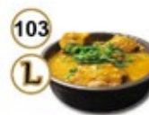
103 L BRAISED BEEF CURRY Gestooft rundvlees