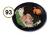
93 SEAFOOD RAMEN Seafood noedelsoep