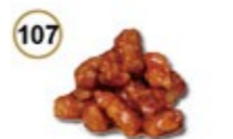
107 PORK IN CHILI SAUS Gefr. varkenhaas in chilisaus