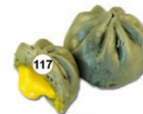
117 SESAME SWEETBUN Gestoomd zoet broodjes