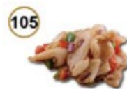
105 FRIED SQUID Gebakken inktvis