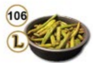
106 L SPICY GREEN BEANS Sambal boonjes